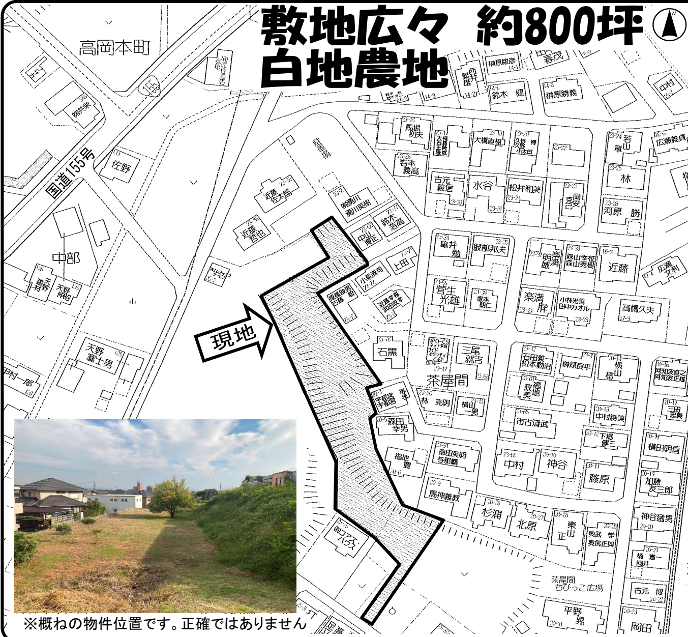
※概ねの物件位置です。正確ではありません