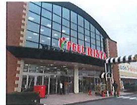
フィールリスタ 約850m