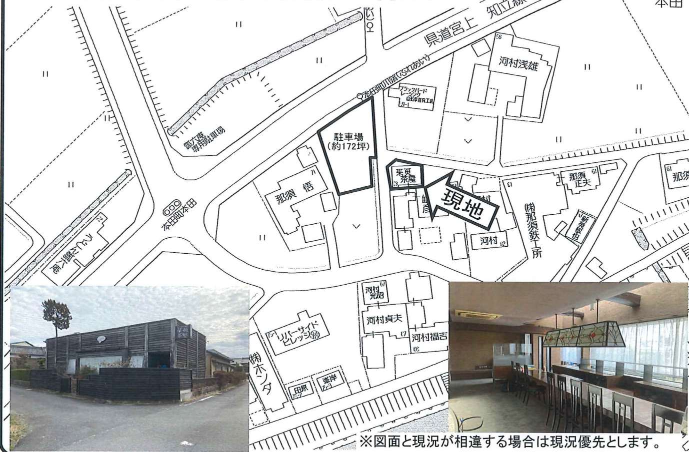
※図面と現況が相違する場合は現況優先とします。